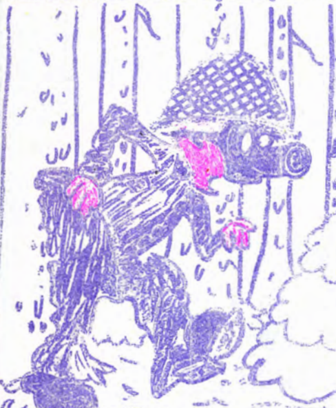
En bild från polisens rekonstruktion vid brottsplatsen....

Det påstås nämligen att någon mindre nogräknad person har lämnat en sån där "hög" som plägar kallas "visitkort" i naturvårdsområdet mellan Kyrkbyn och Långviken. Från