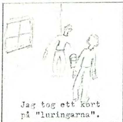
Jag tog ett kort på "luringarna".

gick in till slut och då smög de båda lur- ingarna in i källaren och gömde någonting.