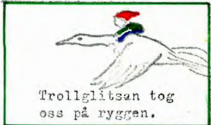
Trollglitsan tog oss på ryggen.

De ville ju att vi skulle stanna veckan ut, men vi måste passa återresan, som vi inte visste riktigt när den skulle ske, så glitsan flög oss tillbaka till Trollsykien.