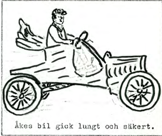
Åkes bil gick lungt och säkert.

Å' jag kunde ju inte gärna skicka hela bordet, va".