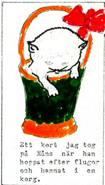
Ett kort jag tog på Måns när han hoppat efter flugor och hamnat i en korg.

skulle göra då? Jag får minsann gå ut jag, vad det än är för vä- der. Å' har ni sett hur löjligt han bär sig åt då han fångar flugor? Sitter och stirrar i taket å' hoppas rätt upp, flera meter och bryr sig inte om att han dim- per ner i stekpannan eller soppskålen eller var som helst. Urlöj- lig, det är just vad han är, sa Trolle och gäspade och somnade bums. Så trött var han.