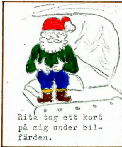
Rita tog ett kort på mig under bilfärden.

Just när bilen stannade vid Trollsykiens tullstation fick vi se