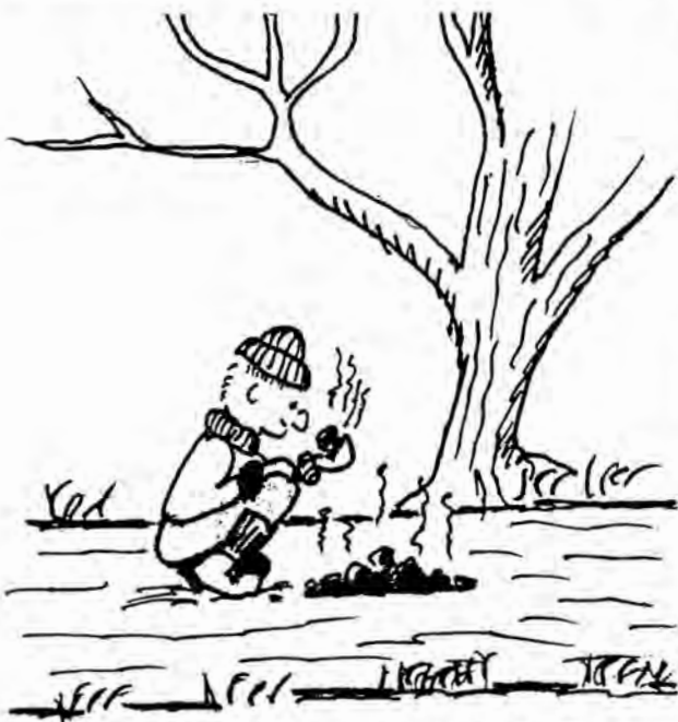
SVEN HÄMTAR EN NY HÄSTSKIT.