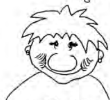
Klumpe blev kär under året som gick.

Min käresta var här i åtta dagar och det är en kort tid, speciellt när vi bor så långt ifrån varandra. Men under dessa dagar var det jag som svävade på små fluffiga trollhimmelmoln.