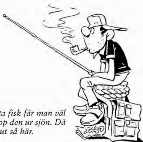
Ska man äta fisk får man väl först dra upp den ur sjön. Då kan det se ut så här.

– Det är underbart. Han skapar sina konstverk på dagen och jag lagar maten. På kvällen gissar vi vad det ska föreställa.