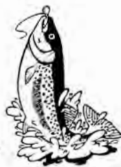
En fisk på hugget.

kokt strömming inte kan vara så svårt. Tankarna for runt i huvudet. Tanken var ungefär så här: