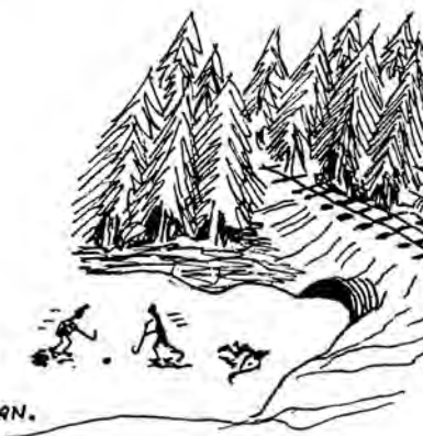
UNGARNA NERE VID LAKVIKA, MED VÄATRUMMAN.