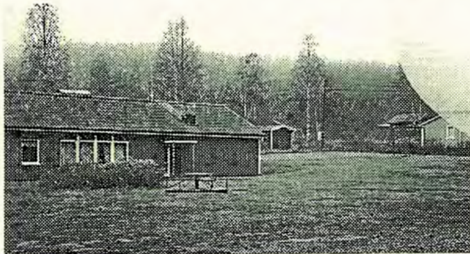
Bilderna visar en del av nästa års träffplats. Slädaviken på Alnö. Kusinerna från trakten kring Sundsvall hälsar oss välkomna till en trivsamt vecka i augusti.