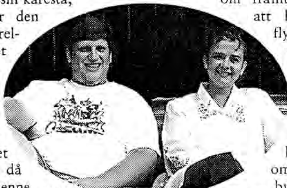
Så här ser Klumpe och hans käresta ut när de har förklätt sig till människor.

om framtiden, om att hon skall flytta hit, att vi skall byta ringar och ha fest (vi har inte bestämt om vi skall byta näs- eller örringar än) och