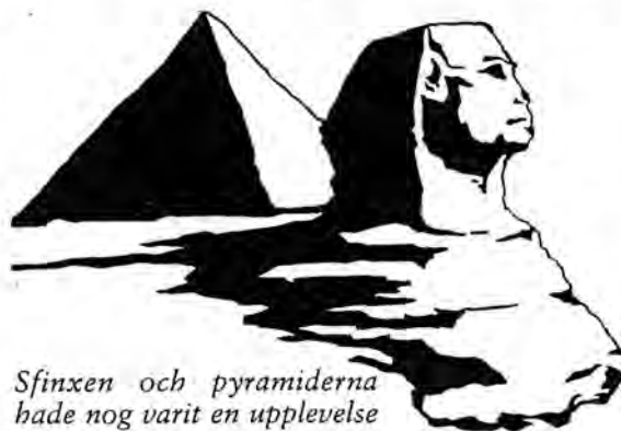
Sfinxen och pyramiderna hade nog varit en upplevelse att få se.

skällde lite men försvann till slut till sin hytt. I allafall försvann skepparna, men vi salade ihop pengar och hyrde in en speedbåt