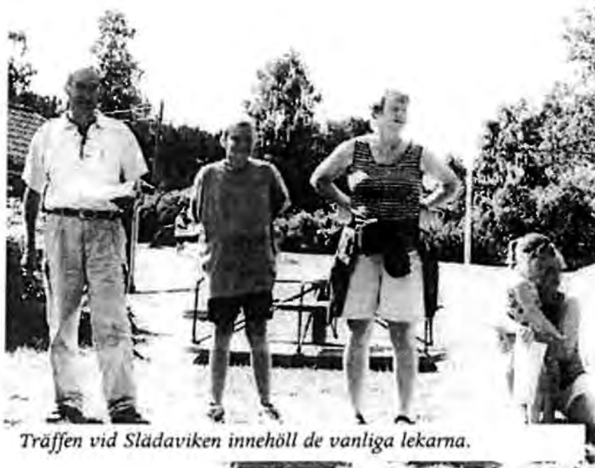
Träffen vid Slädaviken innehöll de vanliga lekarna.