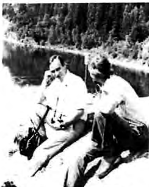
Bröderna några år efter utflykten.