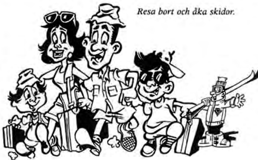
Res bort och åka skidor.

Men när vi kom upp på Lördagskvällen blev vi mycket besvikna, det var 3 grader varmt och slaskigt. Vattnet rann i strida strömmar från berget bakom hotellet och planen framför entrén var alldeles lerig. Vi gick in och fick våra nycklar och ett beklagande över att dom inte