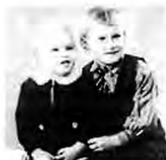
Bröderna några år före utflykten.

Under tiden Nils suttit och tänkt på detta hade pojkarna