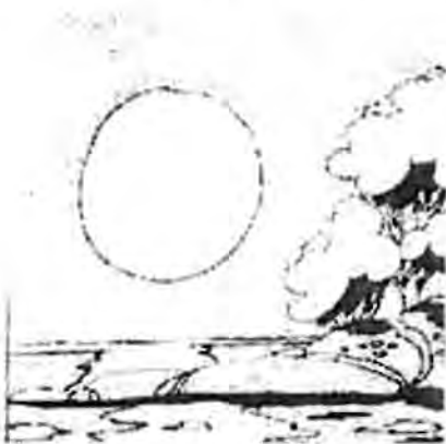
Det var en vacker morgon, solen sken och sjön låg spegelblank.

Nils hade tjtat hela sommaren om att dom skulle göra någon utflykt, men Sven hade aldrig tid. Sven jobbade på Jönssons Bageri i stan och på helgerna