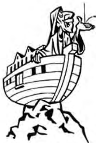
Den lilla ekan sköt bra fart i vinden.