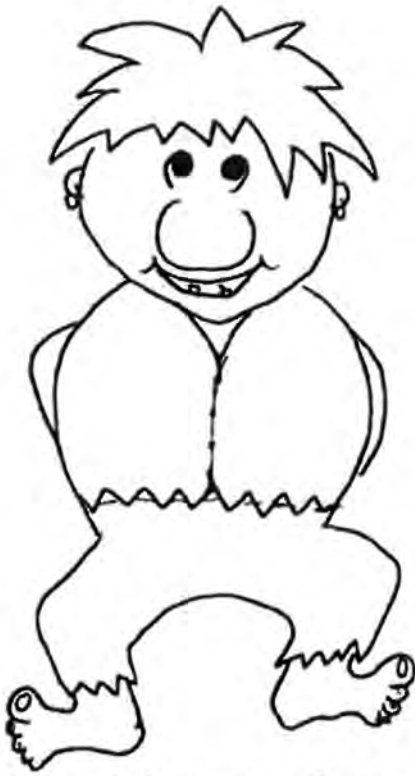
En av skyltarna som Klumpe såg som fascinerade honom var denna parkeringsskylt.