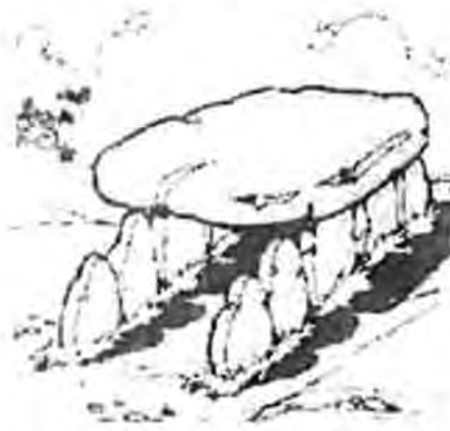
Vid Bergforsen såg dom en konstig stenformation.

byta av varann eftersom det bara fanns ett årpar i ekan.