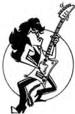
Jimi Hendrix i aktion.

- Jaha, sa hon insiktsfullt och verkade inte alls förstå att jag