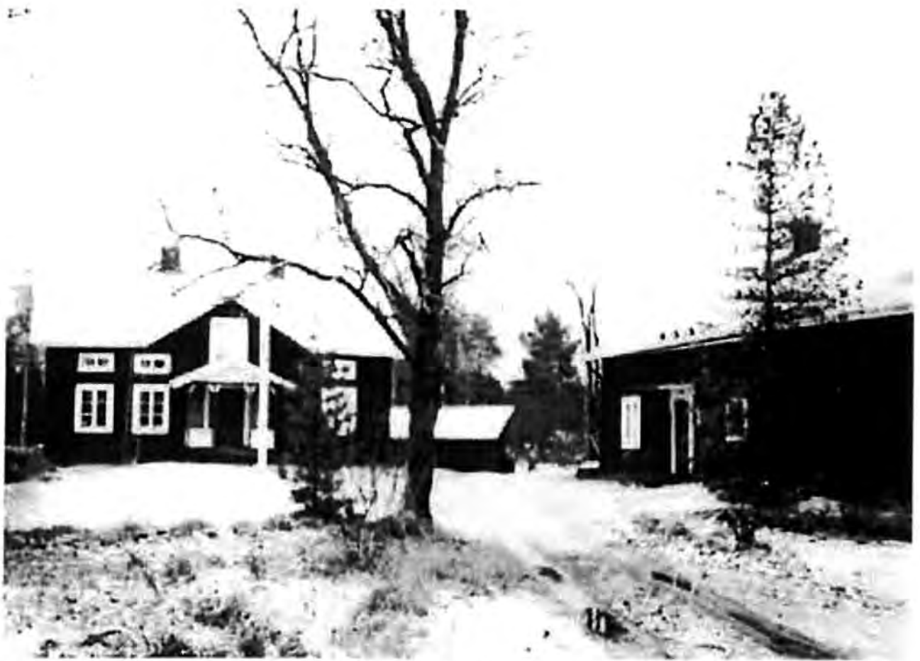
Bondgården i Östby finns alltjämt kvar. Här bodde släkten Östby i flera generationer.

gården, och skyndade ut genom storporten. Där stannade de vid stora kornladan, svängde med hästarne af och an samt larmade mycket.