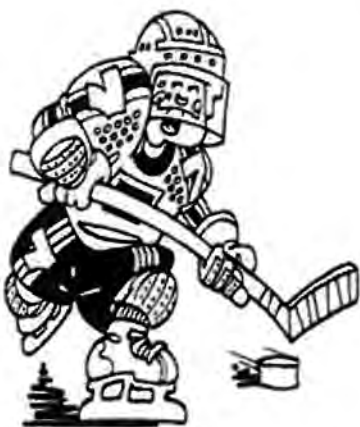
Sveriges bästa hockeyspelare lirade för Brynäs vid den här tiden.

och lyckades få upp även denna dörr. På sängen satt en liten, liten pojk i grå kläder och en knallröd toppluva. Han berättade att han blivit fångad när han hade gått omkring inne i skogen ovanför hotellet och gjort vinter. Jaha tänkte jag, då var det säkert hans pappa jag sett förut. Och att göra vinter var väl att plocka undan alla sommarens prylar inför vintern. Men han fortsatte berätta att han var en tomtensse fast han hette Glont och att han hade gjort vinter på riktigt. Han hade gått omkring före sin far och sagt åt alla växter och djur att nu skulle snön snart komma sedan skulle hans far komma med någon slags låda som på något vis gjorde så att snön skulle falla. Konstigt men inte konstigare än allt annat som hänt på sista tiden.