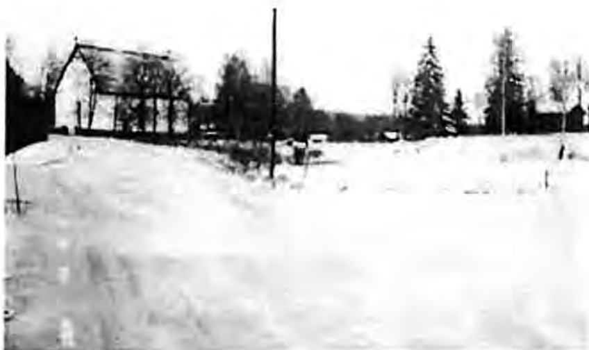
Här utkämpades "striden" 1721 mellan ryssarna och de tre tappra från Enånger. Mest var det ett ordkrig, men det räddade Enånger undan ryssen.