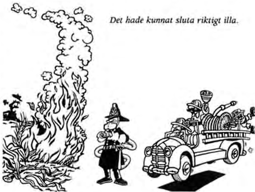
Det hade kunnat sluta riktigt illa.

Någon gång mitt i natten vaknade jag av att det stack fruktansvärt i ögonen. Att det var något som inte stod rätt till förstod jag och hoppade därför upp och tände lyset.