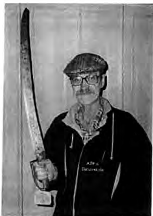
Här är sabeln som min morfars farfars farmors far använde 1721. Den finns bevarad på Enångers museum på vägen till Borka brygga.

Vi kan också konstatera att Michel i Östby, som han kallades, var en betrodd man. Han blev med åren nämndeman, det vill säga att han satt i rätten och dömde. Han kom att förbli hemmanet Östby 1 troget och det var också ett hemman som stannade i släkten till morfars far på 1800-talet. Då styckades hemmanet upp och min morfar övertog senare en del, en s.k. Sub, som fick beteckningen Östby 1 sub 2. Denne avyttrades dock och morfar lämnade så småningom