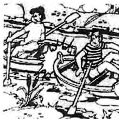
Det var dubbla årtullar i båten. Tur att det inte var två båtar, det hade gått illa.

Nere vid bryggan låg båten och väntade på dom. Det var en gammal fiskebåt som en av deras morbröder i Enånger haft. Den var längre än