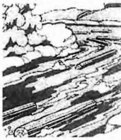
Det var nästan ingen massaved kvar i Avan.

- Jaha, va är det för krabater som är här då, hördes en mörk röst bakom pojkarne. Pojkarne snodde runt, där stod Arvid.