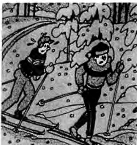
Byvika skulle ha ett lag i stafetten, tyckte Alvar.

- Ja men jag bo ju inte i Byvika, Ja bor ju i Burmon.