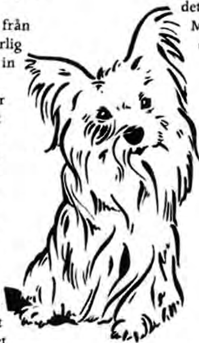
"Buffan" i egen hög person.

Sedan var det här med ischiasen som jag har haft besvär med. Ja, inte så att jag själv har haft någon ischias utan det är matte som drabbades i sommar igen. Det kan ju tyckas att inte jag skulle behöva klaga över det