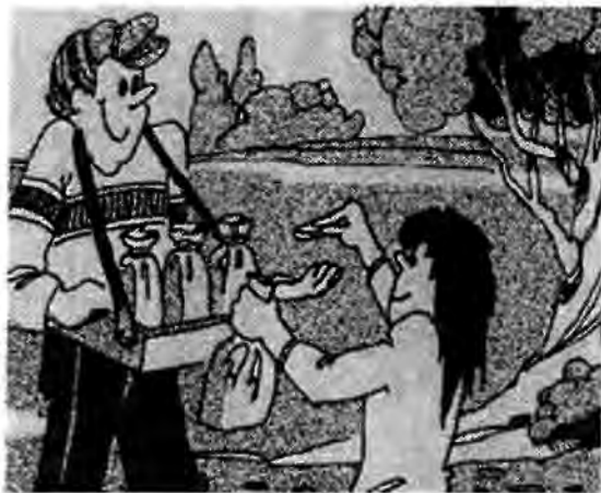
"Kaffe-Petter" hade ett litet parti med riktiga bönor.

- Va säje du, ska vi ta dom rektige bönera på blanka vardan! Då va då värsta, sa Kajsa när