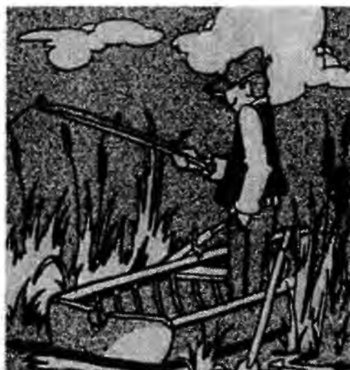
Frank o Alvar pratade fiske.

Han fick cykla försiktigt nu för det var