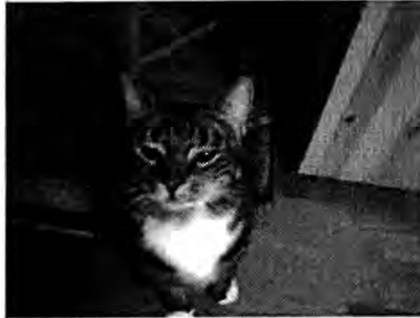
Huskatten kom smygande och stannade vid väggen. Hon hade blivit nyfiken på ljudet.

De stod och väntade både länge och väl i