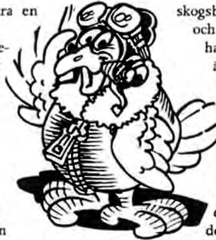
En annan fågelpilot

"För flera hundra år sedan hände det att en präst från Delsbo var ute och red en nyårsnatt mitt i täta skogen. Han satt till häst, klädd i päls och skinnluva och på sadelknappen hade han en väska, där han förvarade nattvardskärlen, handboken och prästkappan. Han hade varit kallad i sockenbud långt bort i